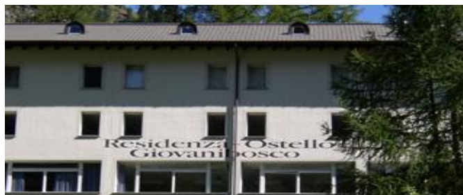
Dojo Residenza Ostello Giovanibosco

Tutti i partecipanti devono essere assicurati privatamente contro gli infortuni ed avere una copertura assicurativa in caso di ospedalizzazione e/o intervento medico in Svizzera.