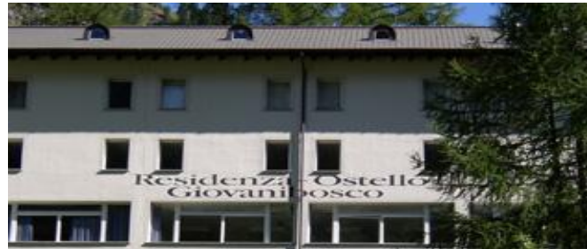
Dojo Residenza Ostello Giovanibosco

Tous les participants doivent avoir une assurance accidents qui couvre aussi d'éventuels frais médicaux et d'hospitalisation en Suisse.