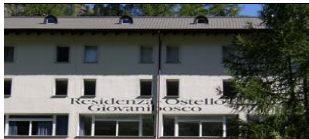
Dojo Ostello Giovanibosco

Alle Teilnehmer müssen privat unfallversichert sein, auch für ärztliche Behandlung oder einen evtl. Krankenhausaufenthalt in der Schweiz.